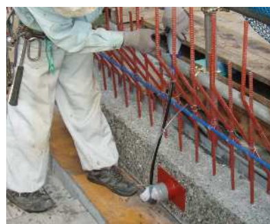
エポキシ樹脂注入状況