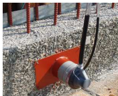
注入後、硬化までに自然沈下 によって空隙が充填されます。